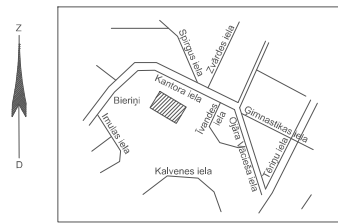
Objekta izvietojuma shēma