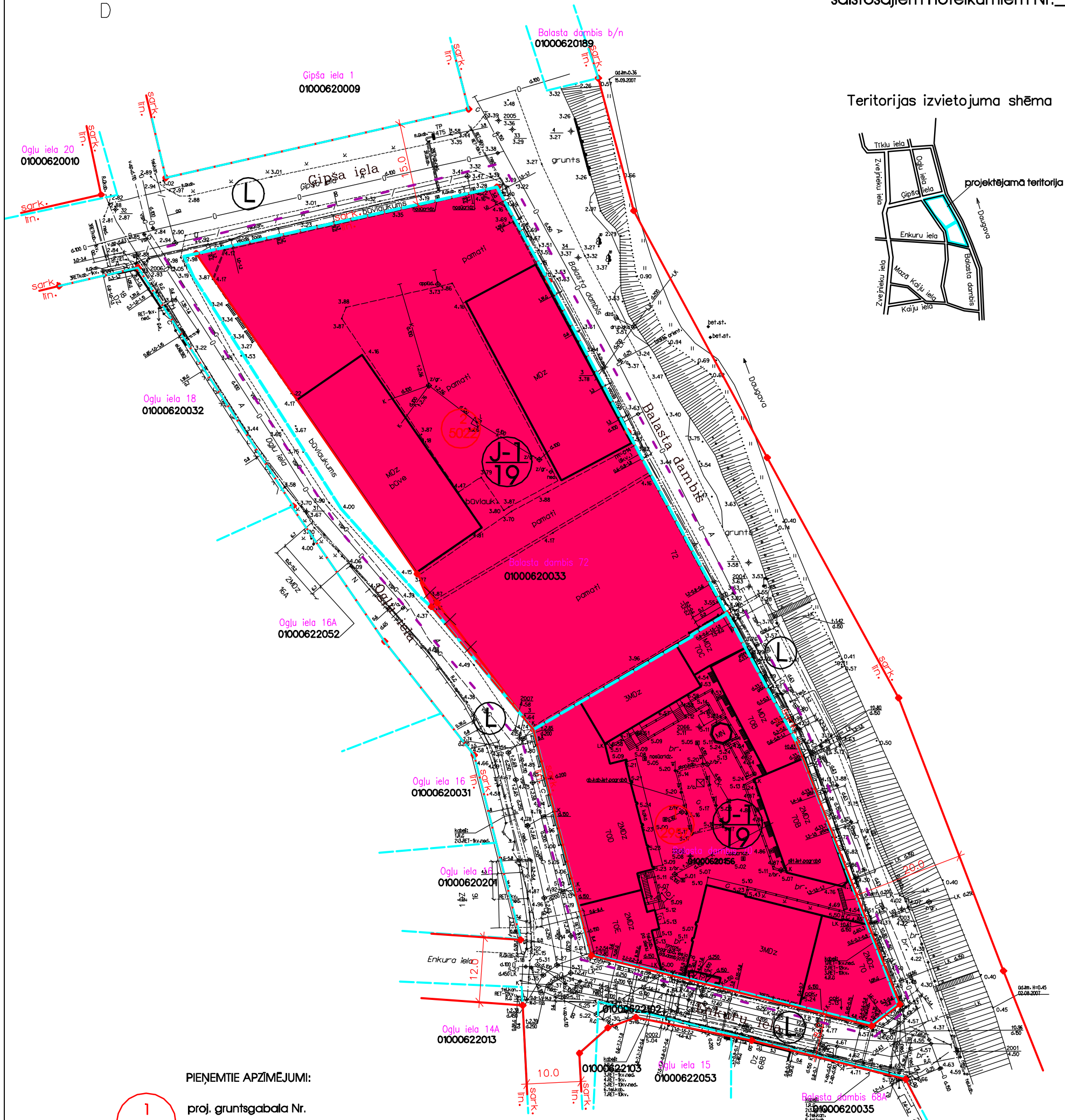
Teritorijas izvietojuma shēma

Rīgas domes 2007. gada _____ saistošajiem noteikumiem Nr. _____