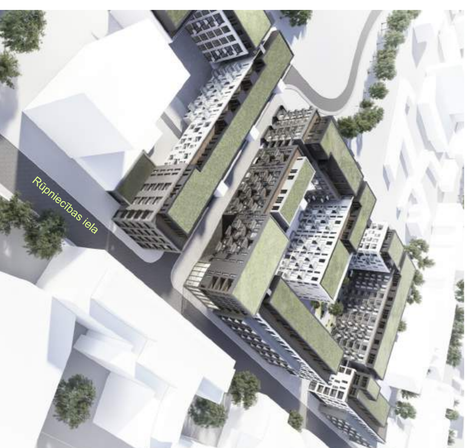
PLĀNOTĀ APBŪVES VIZUALIZĀCIJA