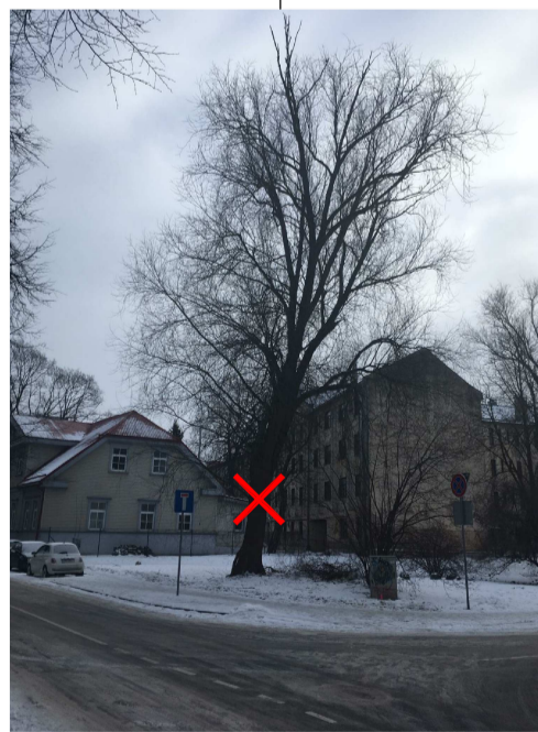
VĪTOLS Ø 87