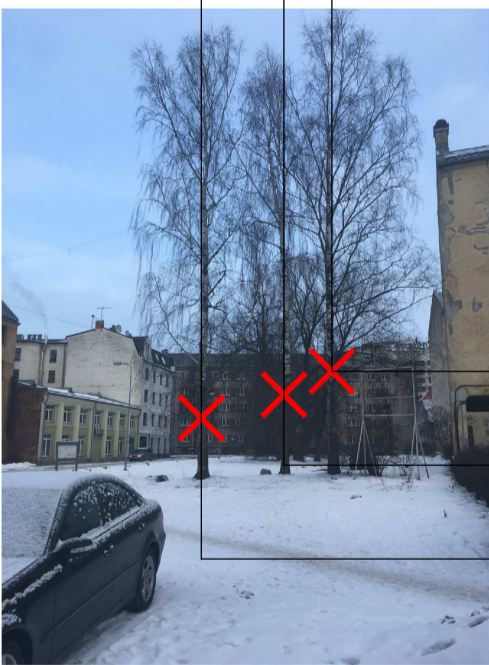
BĒRZS - bojāts, ir izdota atļauja ciršanai