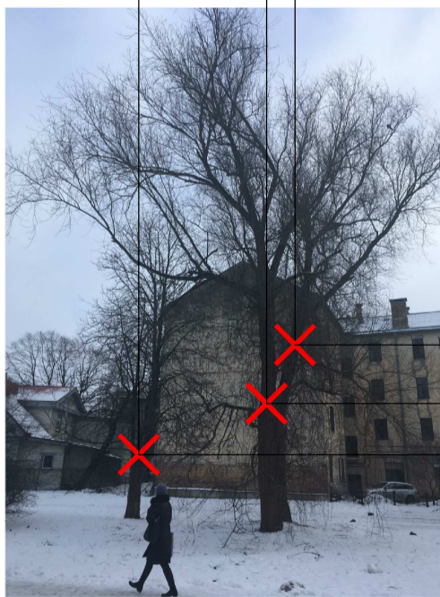
VĪTOLS Ø 67