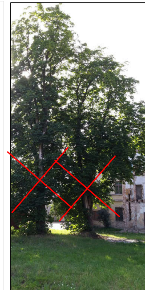
Zirgkastaņas Ø 63 un 70 cm.