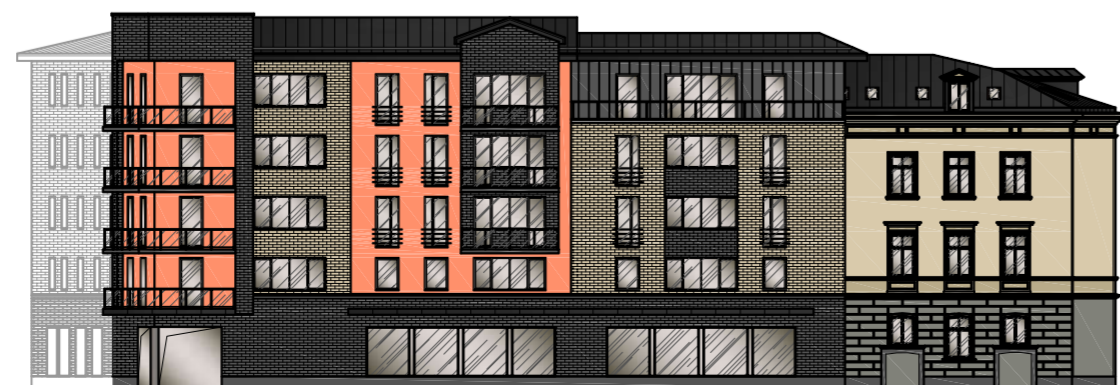
Fasāde pret Jelgavas ielu