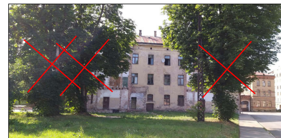
Zirgkastaņas Ø 63, 70 un 72 cm.