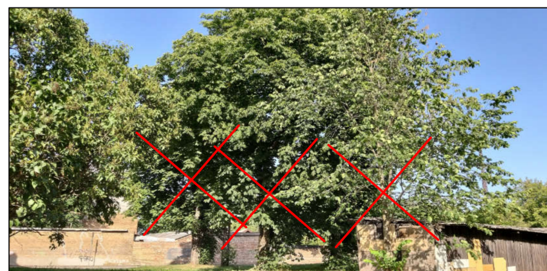
Zirgkastaņas Ø 63, 70 un goba Ø 23 cm.