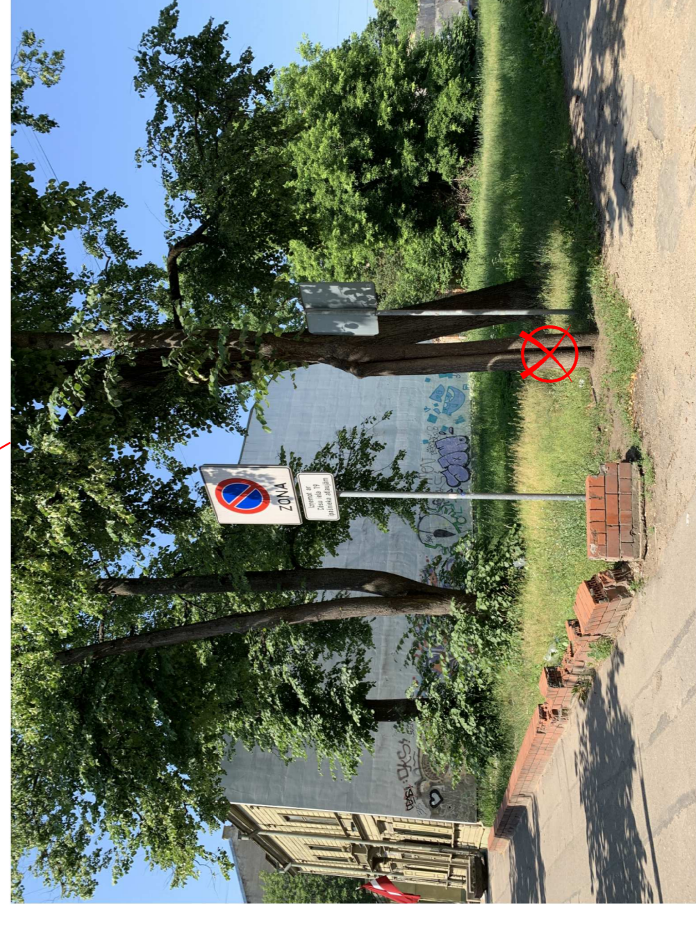
Liepa ø 30 cm.