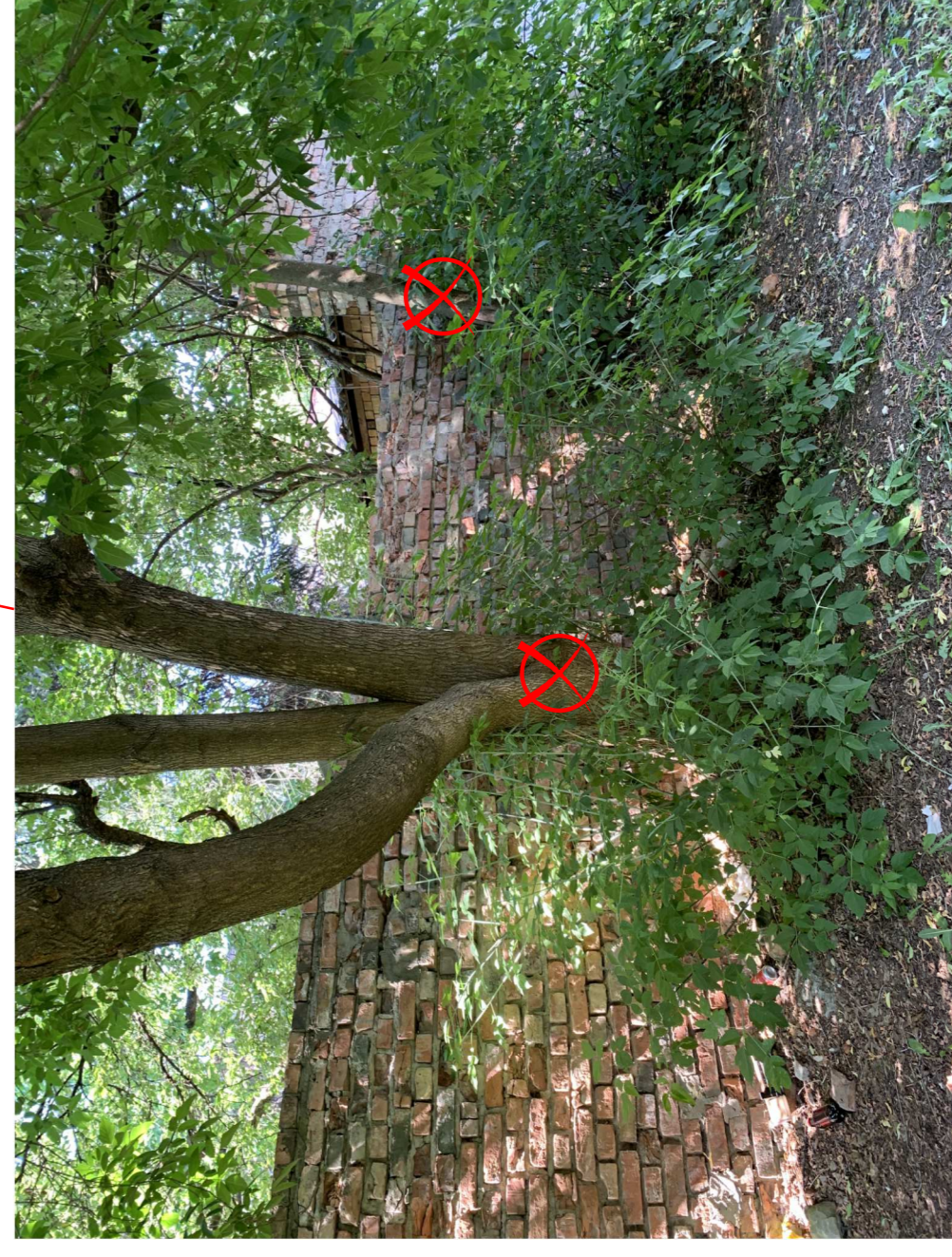
Ošlapu kļava ø 21/44 cm un ieva ø 18 cm.