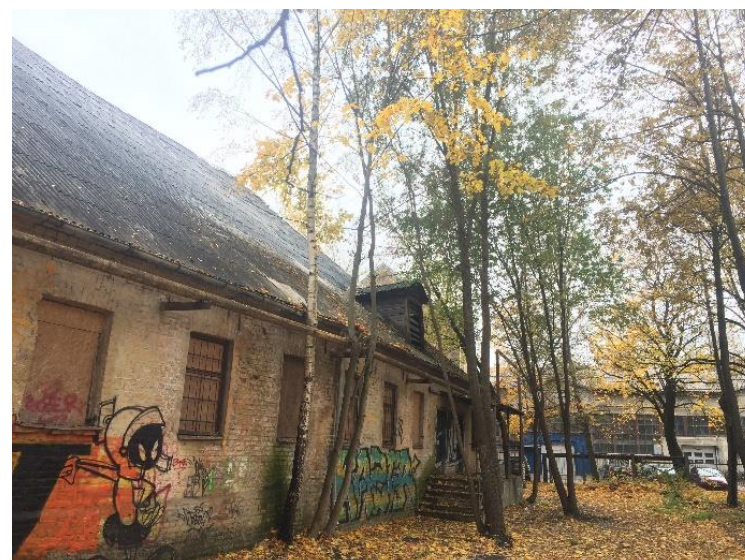
bērzs \varnothing 23 cm, kļava \varnothing 17 cm