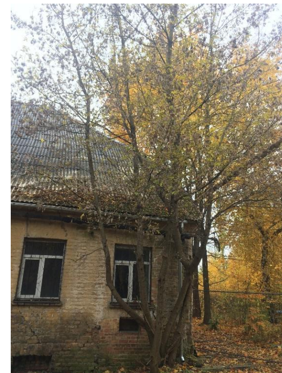
ošlapu kļava \varnothing 17/17/17/15 cm