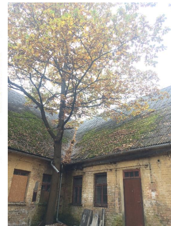
ozols \varnothing 49 cm