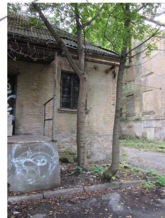
2 ošlapu kļavas \varnothing 26 cm un \varnothing 17 cm