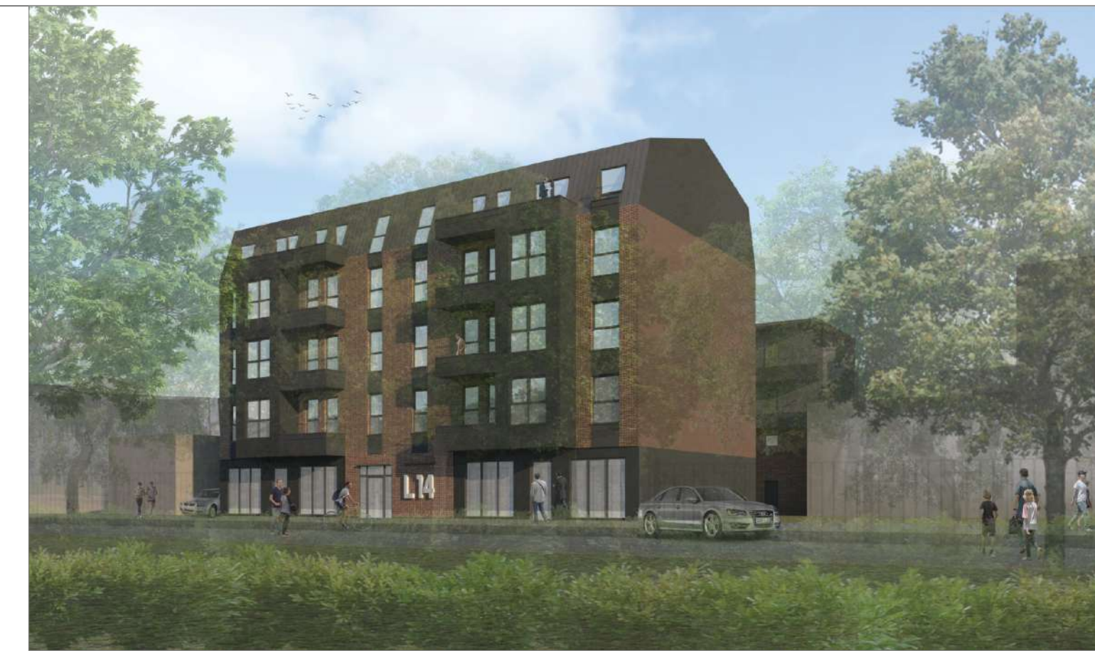
Vizualizācija vides kontekstā. Skats no Lauku ielas.

5. pie koku ciršanas ierosinātāja, Rīgā, Tallinas ielā 94-2, kontaktpersona: Natalja Arestova, tālr. 29712842.