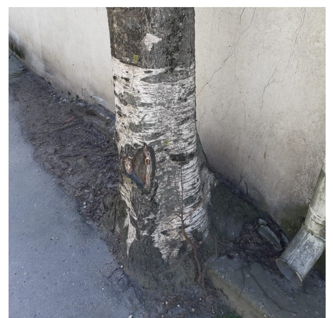
1 bērzs \varnothing 31 cm