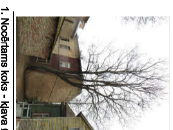
1. Nocērtams koks - kļava Ø 68