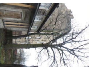
6. Nocērtams koks - Ozols Ø 75