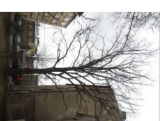
3. Nocērtams koks - Ozols Ø 35