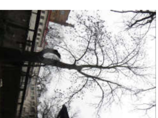
4. Nocērtams koks - Osis Ø 58