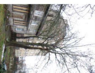
7. Nocērtams koks - Ozols Ø 55