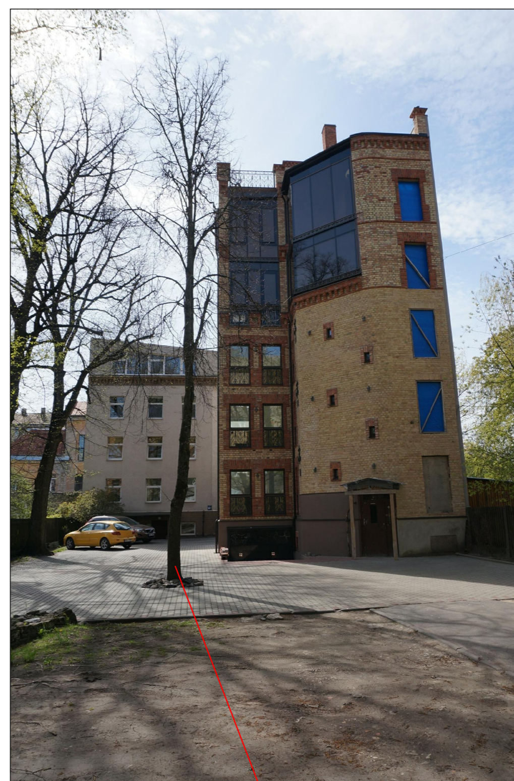
Liepa ( diam. 32 cm )