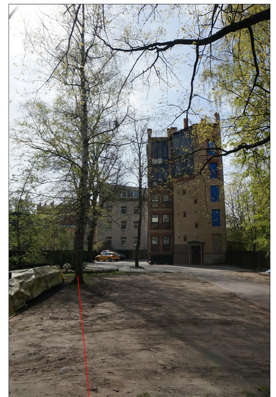
Bērzs ( diam. 31 cm )