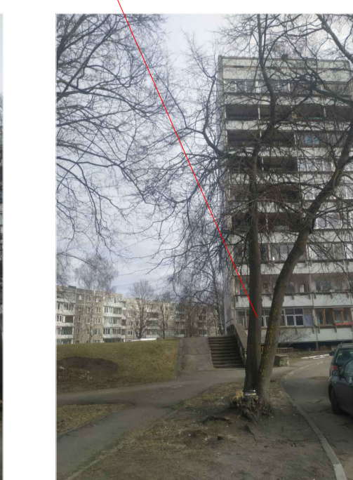
1 liepa \varnothing 31/39 cm