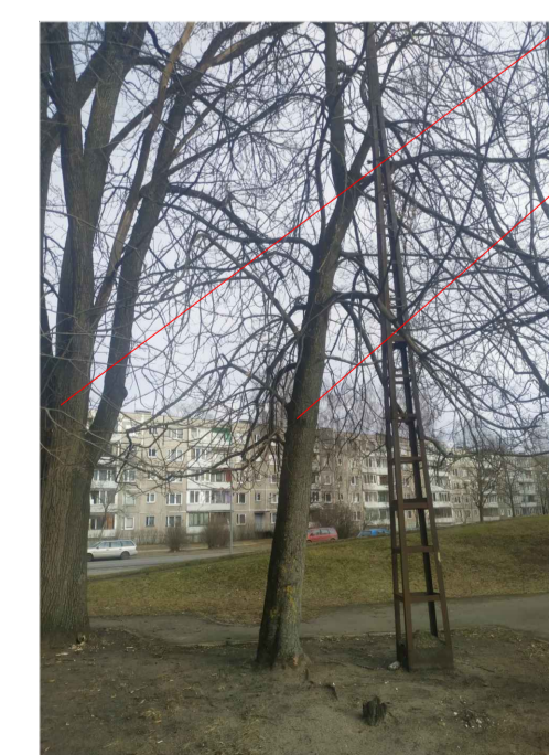
1 zirgkastaņu \varnothing 35 cm un kļava 65 cm