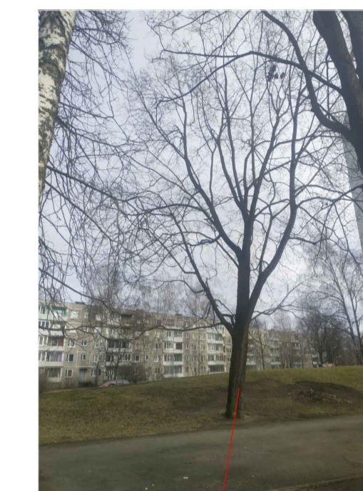
kļava \varnothing 55 cm