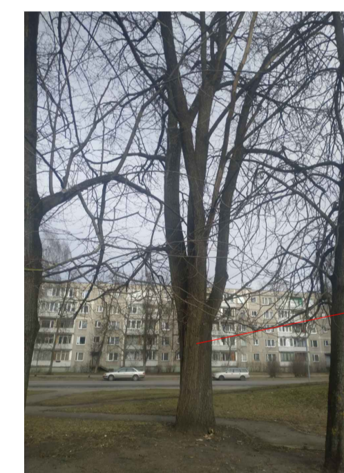
1 ozols \varnothing 76 cm