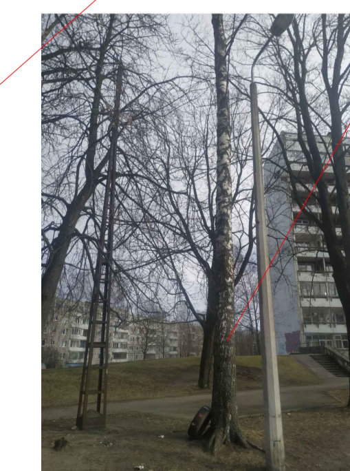
1 bērzs \varnothing 45 cm