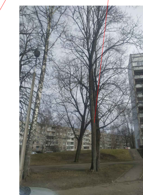
kļava \varnothing 31/39 cm