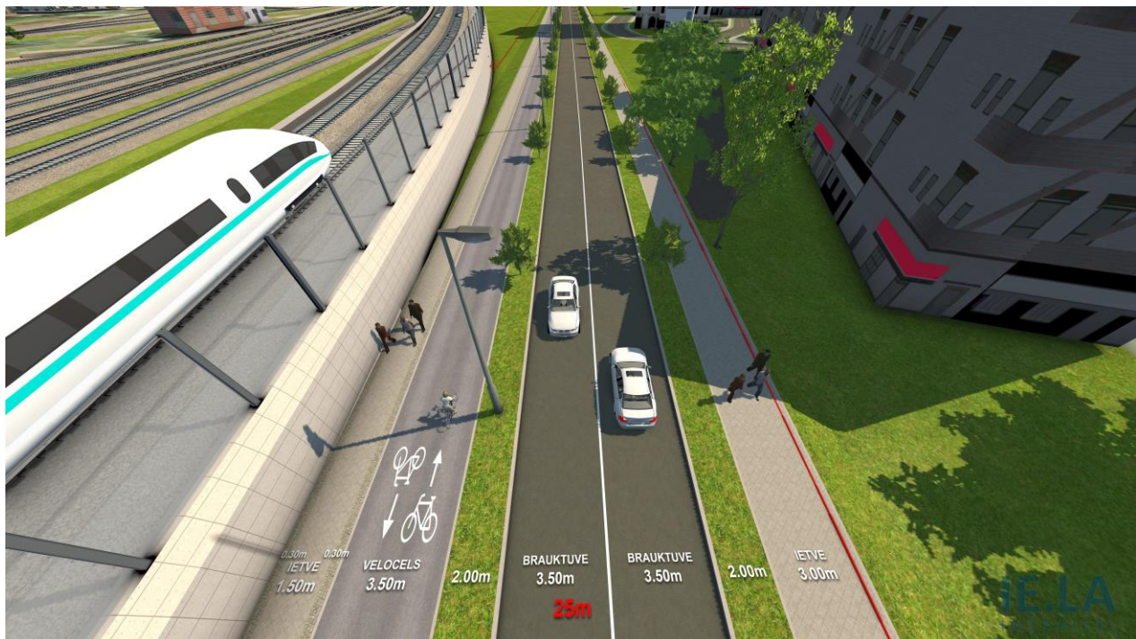
3. attēls. Posms no Lokomotīves ielas līdz Slāvu pārvadam.