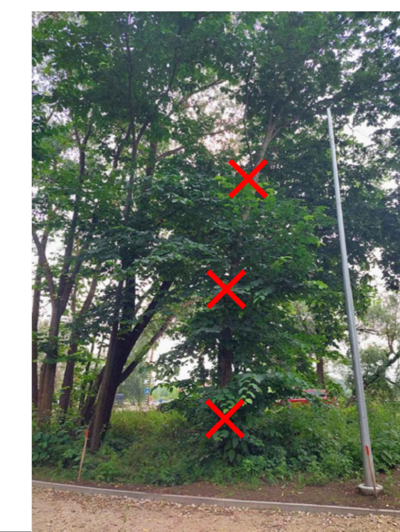
Nocērtamais koks Nr. 4 - GOBA