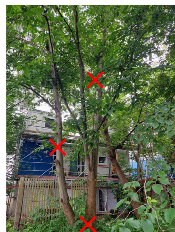
Nocērtamais koks Nr. 1 - GOBA