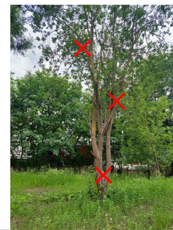
Nocērtamais koks Nr. 3 - BLĪGZNA