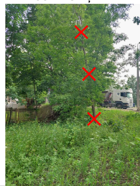
Nocērtamais koks Nr. 2 - OŠLAPU KĻAVA