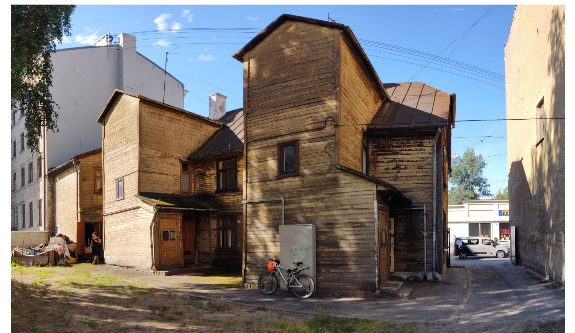
4. teritorijas fotofiksācija