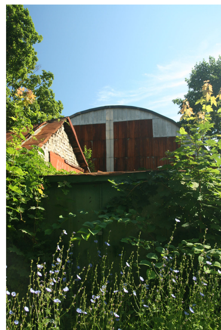
2. teritorijas fotofiksācija