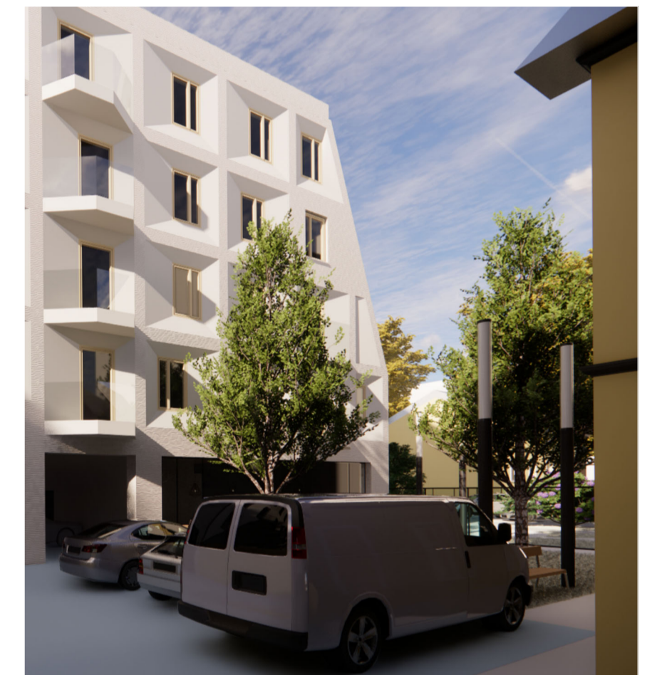
5. ieceres pagalma skats