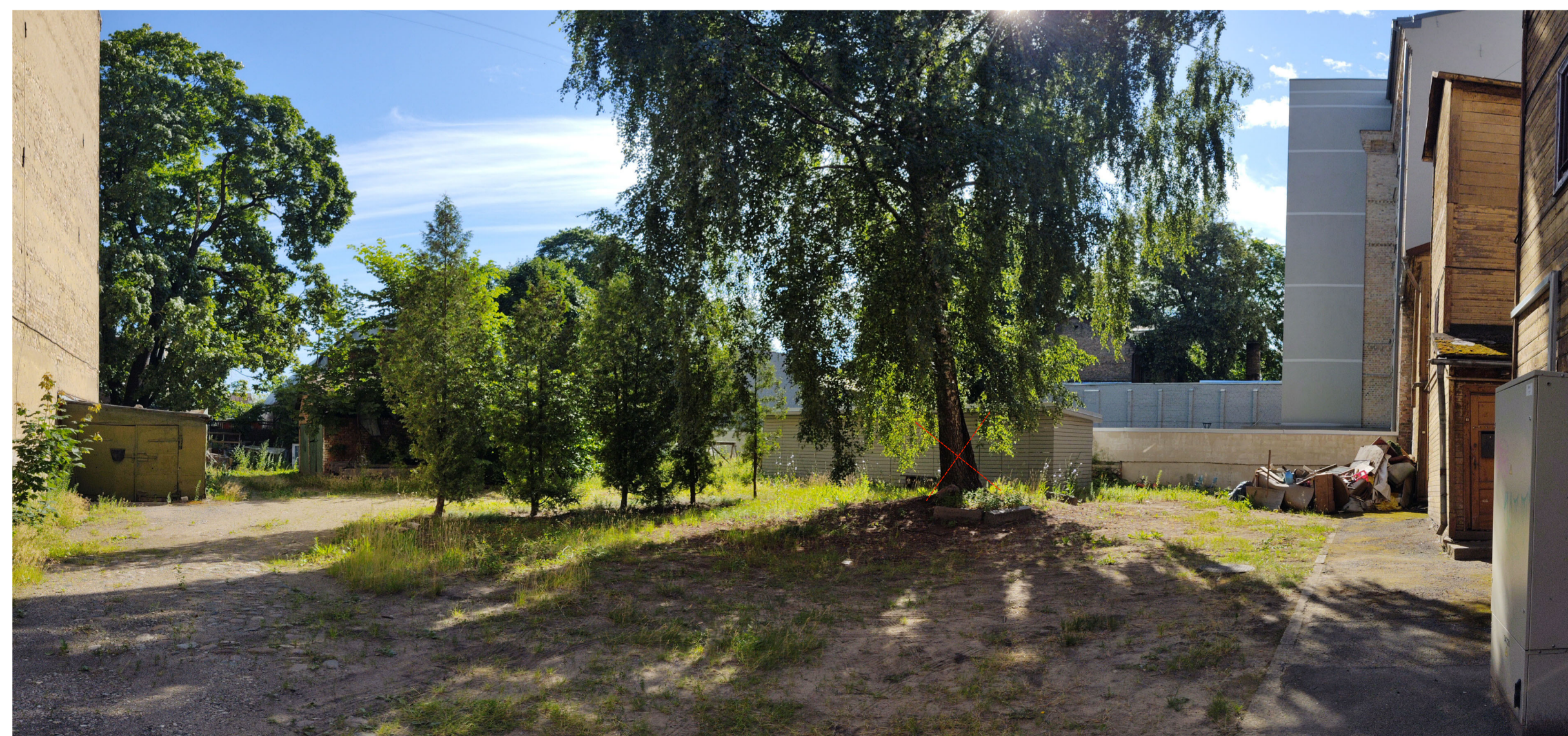
1. teritorijas fotofiksācija ar nocērtamo koku - bērzu \varnothing 40/47 cm