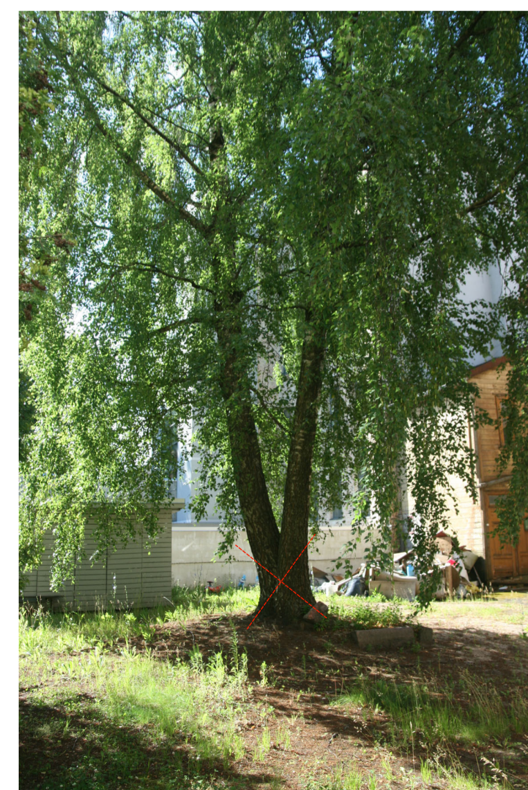
3. nocērtamais koks - bērzs \varnothing 40/47 cm