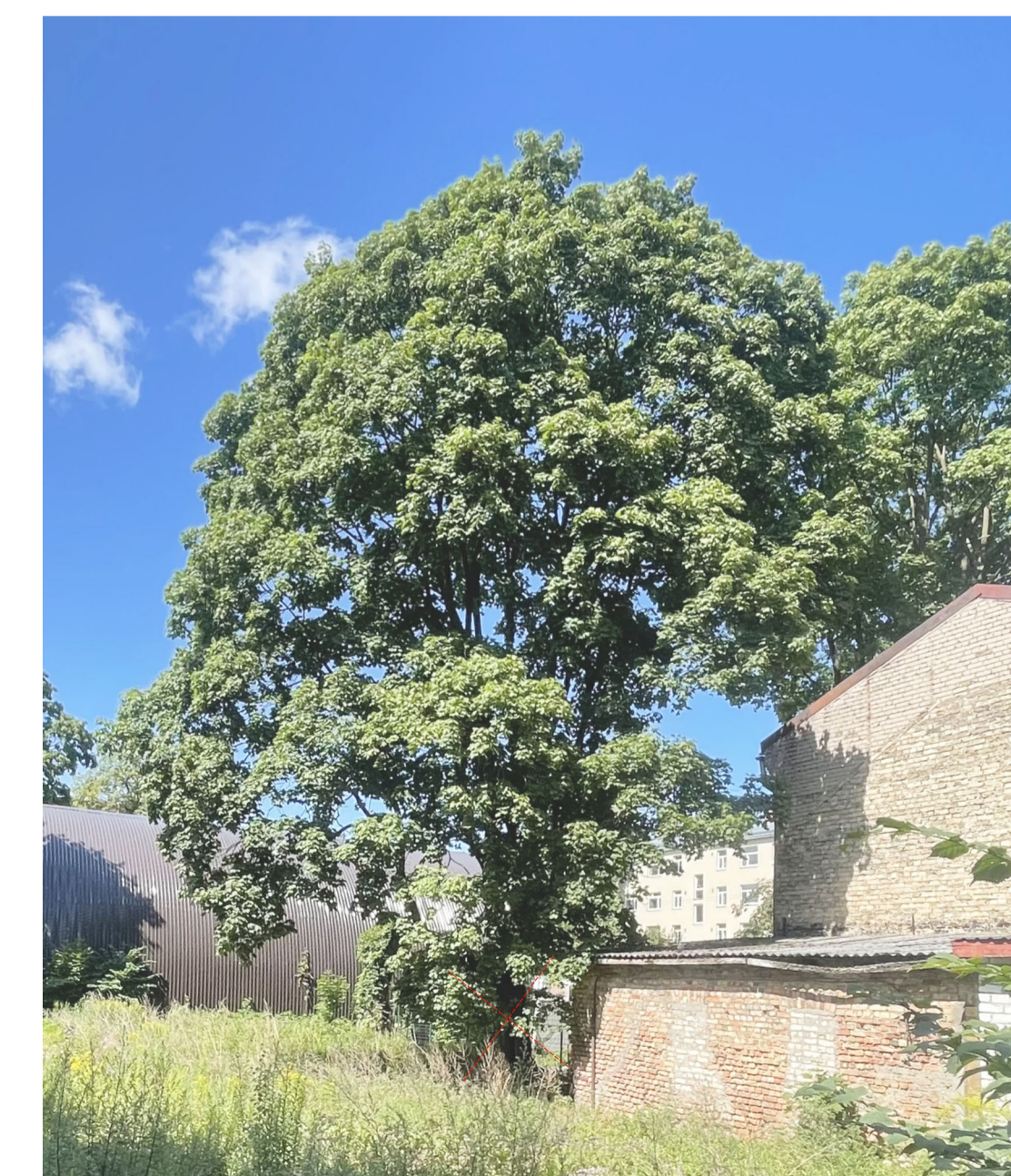
3. nocērtamais koks - kļava \varnothing 89 cm