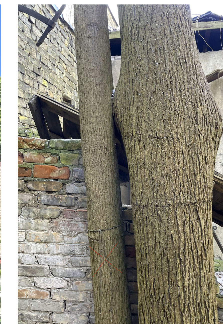
3. nocērtamais koks - goba 15 cm (celma caurmērs 23 cm)