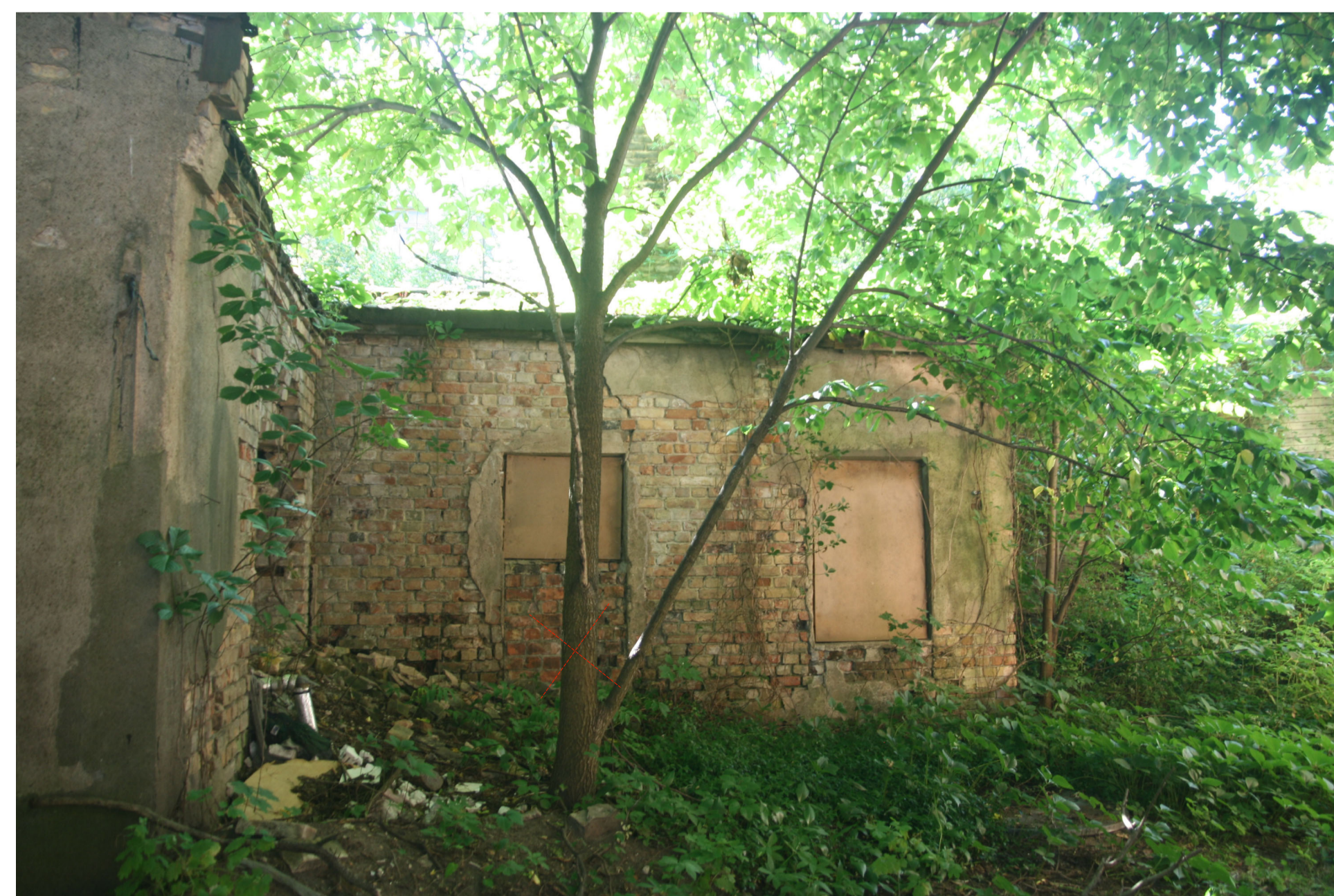
2. nocērtamais koks - goba \varnothing 20 cm