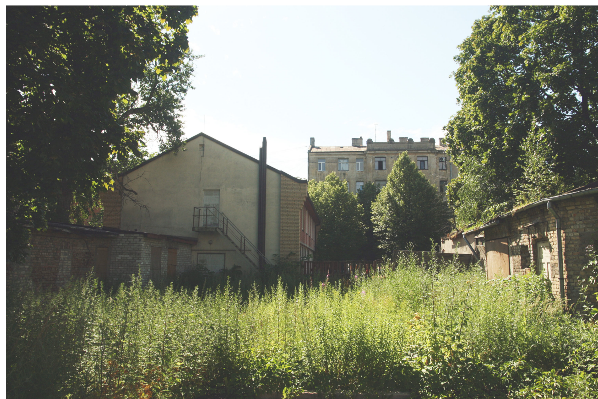
1. teritorijas fotofiksācija