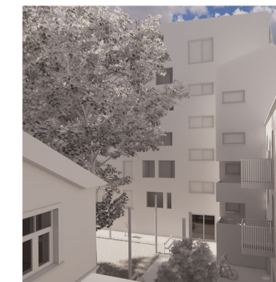
5. ieceres pagalma skats