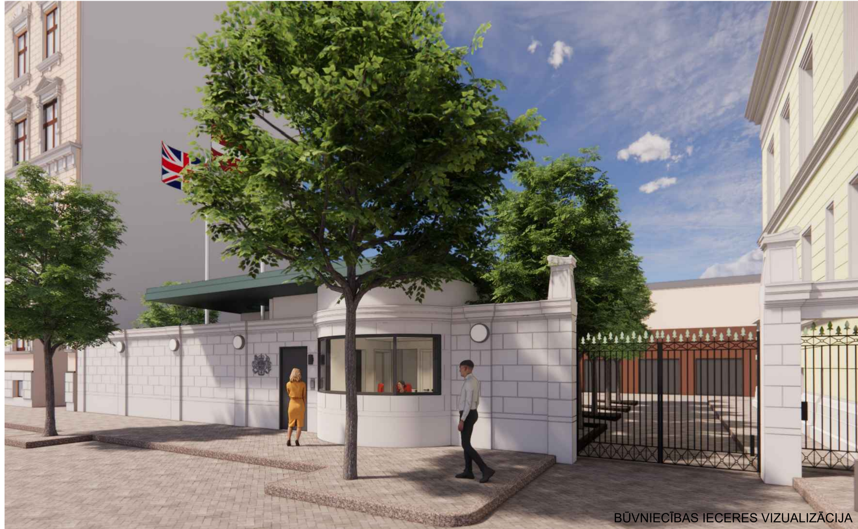
BŪVNICĪBAS IECERES VIZUALIZĀCIJA